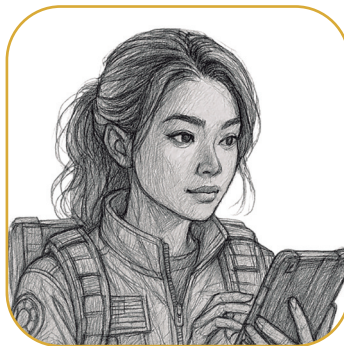
DRA. LENA ZHOU

Es el líder de la resistencia humana. Un ex-militar con un pasado lleno de luchas y sacrificios, Alex tiene un carácter fuerte y una determinación inquebrantable. Sus múltiples cicatrices y su mirada intensa reflejan los muchos enfrentamientos que ha librado contra los invasores alienígenas. En el campo de batalla, Alex es un estratega implacable, dispuesto a hacer lo necesario para proteger a su gente. Con su rifle siempre listo, representa la última esperanza de la humanidad para resistir la invasión.